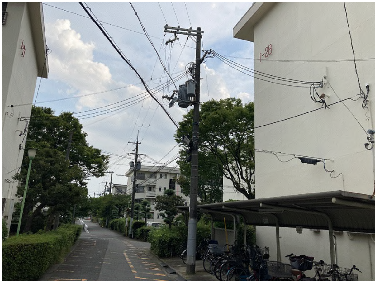
新金岡 C 住宅団地 外観