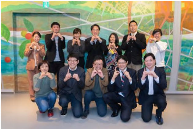
トークゲスト・運営メンバー 集合写真 (撮影のためマスクを外しています)

1月30日に KOITTO TERRACE のオープンを記念して、住民有志によるオンラインイベントが開催されました。まちで働く 100 人を起点に人と人をつなげる「江戸川区 100 人カイギ」のゲストトークの配信会場として KOITTO TERRACE が利用され、総勢 42 名(オンライン)の方が参加しました。ゲストのまちに対する熱い想いに触れながら、参加者同士の交流が深まり、今後のまち運営に対する期待が膨らむイベントとなりました。