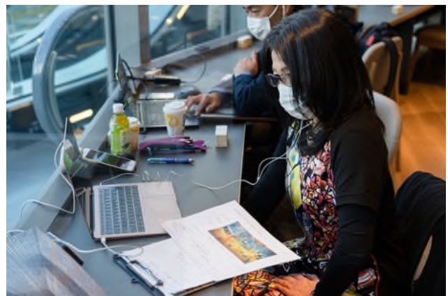
店内アートを担当された方にもゲストとして参加。 アートに込めた想いも参加者に紹介されました。