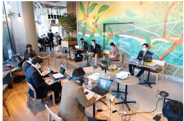
オンラインイベント中の様子。 オンライン会議にも対応できるよう無線 wifi も完備。