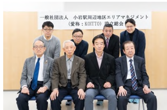
KOITTO 役員及び正会員代表者 (2020年11月16日設立総会にて撮影)