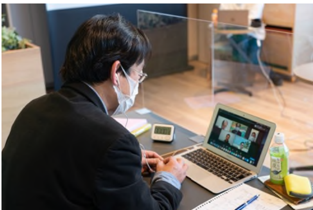
後半では小部屋に分かれて交流会を実施。 各グループごとに活発な意見交換が行われました。