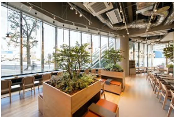
KOITTO TERRACE 内観 (2021年1月29日撮影)

JR 小岩駅の開業から百余年の歴史を刻んできた小岩地区では、現在複数の大規模再開発事業が進行しています。まち全体が新しくなる中で、「まちとヒト」、「ヒトとヒト」をつなぎながら、地域をさらに盛り上げていくため、KOITTO が中心となり、官民地域連携のもと、公共的空間の管理・活用も視野に入れた、魅力あるエリア作りをオール小岩で進めていきます。初動期はコロナ禍の影響を受ける地域を応援するため、オンラインイベント、テイクアウトマップづくりや販売場所の提供、テレワーク支援など、ニューノーマルな暮らしに寄り添ったエリアマネジメントを展開します。