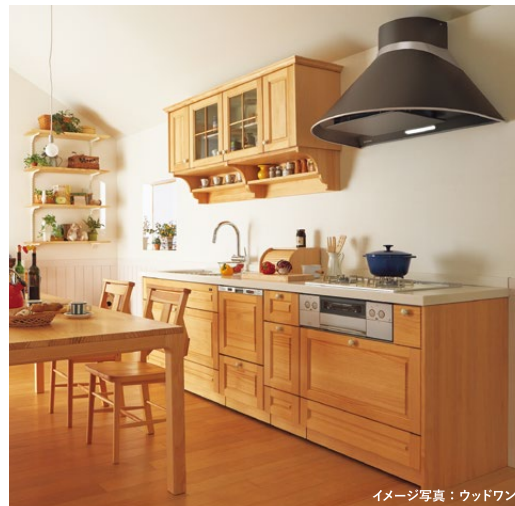
イメージ写真：ウッドワン