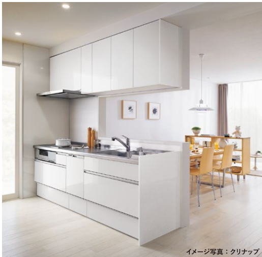
イメージ写真：クリナップ

しまいやすく取り出しやすい、音も静かなスライド収納付き。インテリアになるキッチン。