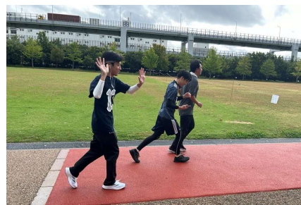
昨年のオンラインチーム対抗駅伝の様子

国内外の社員がランニングアプリを利用し、走行距離を競う「オンラインチーム対抗駅伝」を開催するなど社員が一体感を持って取り組める複数のイベントを実施しています。