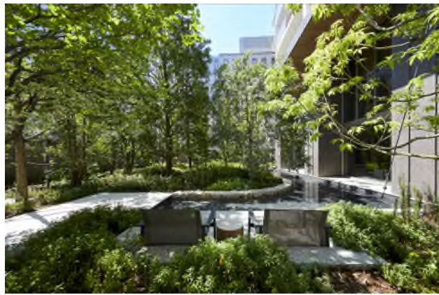
【ローレルタワー堺筋本町】