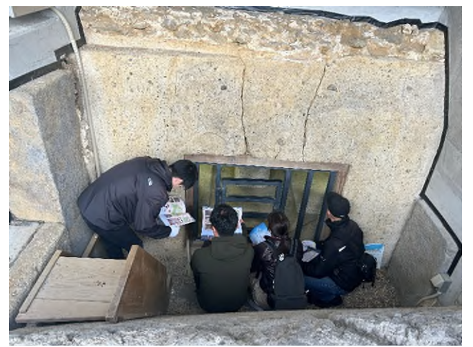
【牽牛子塚古墳の見学】