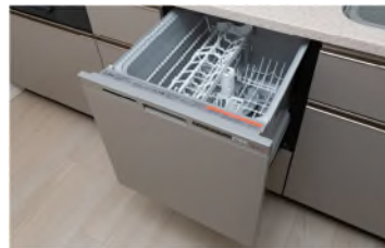
ビルトイン食器洗い乾燥機