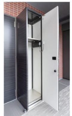
戸別宅配ボックス