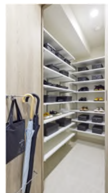
シューズインクローゼット※2