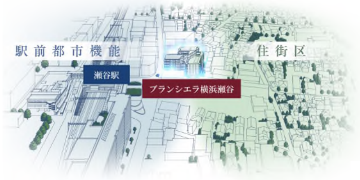
駅周辺街区イラスト