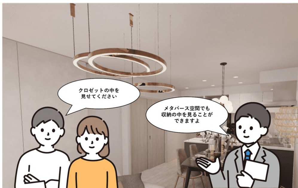
「メタバースモデルルームツアー」見学イメージ図

本物件では WEB 上のメタバース空間に再現した住戸を、購入を検討される方が時間や場所を選ばずパソコンやスマートフォンなどで見学し、実際の生活をイメージしていただくことができます。なお、メタバース空間の物件は長谷工版 BIM データ ※1 から作成しており、間取りや設備、家具・インテリアなどの質感を忠実に再現しています。また、室内にある各種設備の情報は、メタバース空間にポップアップで表示され、画面上で確認可能です。