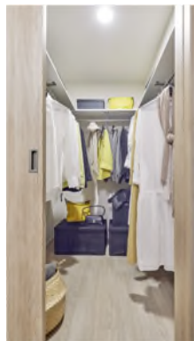
ウォークインクローゼット※1