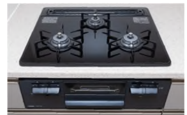
三口ガラストップコンロ