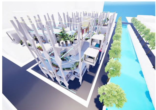
【「長谷工住まいのデザインコンペティション in メタバース」】

2023年に開催された第17回「長谷工 住まいのデザイン コンペティション」の最優秀賞作品を、オンラインゲーム「フォートナイト」にメタバース空間として再現。作品内を見て回ることで、コンセプトを体感することができます。「フォートナイト」は近年ユーザー数が大きく増加し、メタバースプラットフォームを活用したオンラインゲームとして急成長を遂げています。ゲームでの利用以外に様々なワールド（空間）を活用した企業等とのコラボレーションが広がっています。