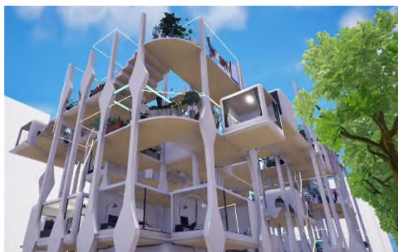
【「長谷工住まいのデザインコンペティション in メタバース」】