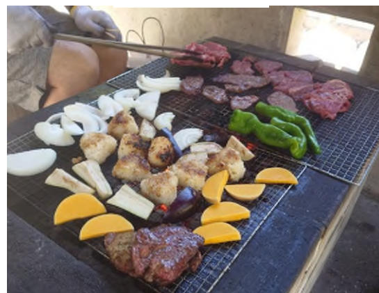
【寄付した野菜を使ったBBQ】