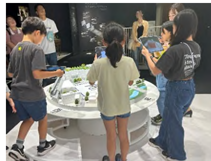
[長谷工マンションミュージアム見学]