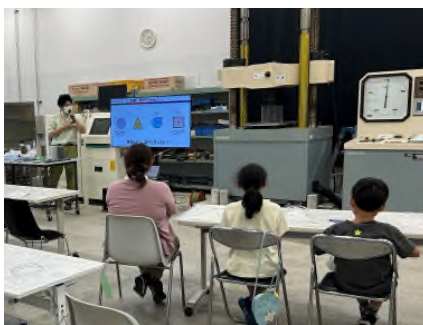
[モルタル練り混ぜ体験]