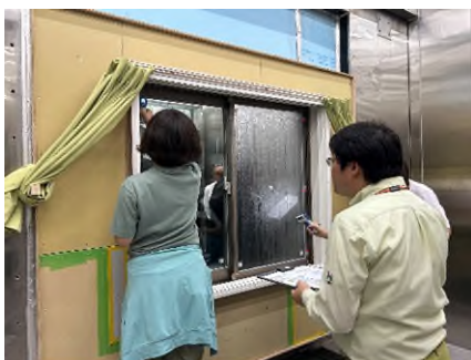
[建物における結露体験講習]