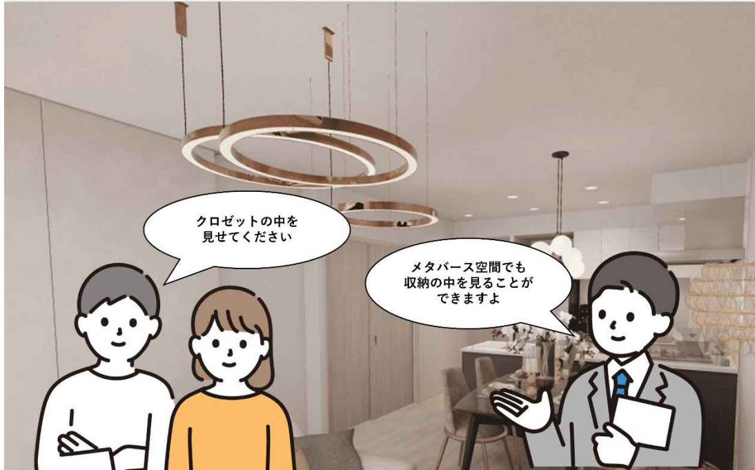
【「メタバースモデルルームツアー」見学イメージ図】

マンションごとに準備しているメタバースモデルルームツアーのサイトにアクセスいただき、事前に見学方法を選択いただきます。見学方法は、1人で内覧できる「プライベート見学」、複数人で内覧できる「グループ見学」、いつでも見学可能な「フリー見学」の全3つの見学方法から選択が可能です。