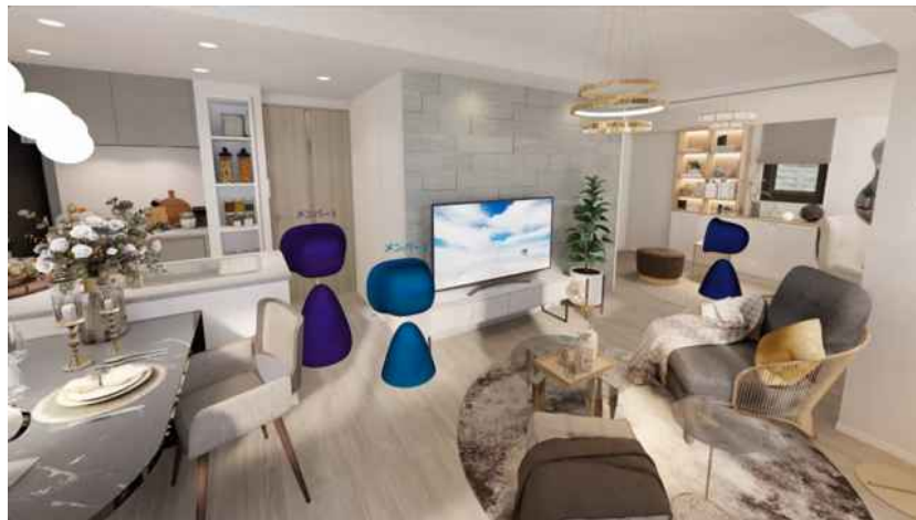
【「メタバースモデルルームツアー」の様子】

本サービスは、WEB 上のメタバース空間に再現したマンション住戸や共用施設を、マンションの購入検討者が時間や場所を選ばずパソコンやスマートフォンなどで見学し、実際の生活をイメージしていただくことができます。なお、メタバース空間の物件はBIMデータ*から作成しており、間取りや設備、家具・インテリアなどの質感を忠実に再現しています。また、室内にある各種設備の情報は、メタバース空間にポップアップで表示され、画面上で確認可能です。