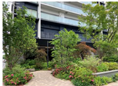
シエリアタワー大阪天満橋