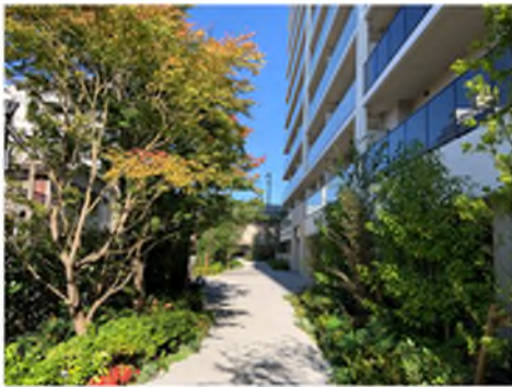
ローレルスクエア OSAKA LINK