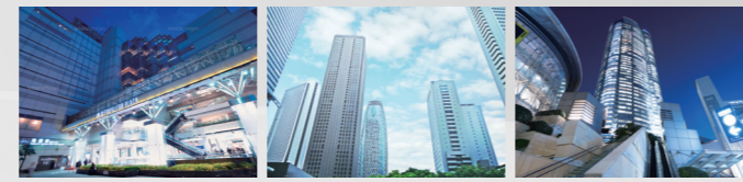
池袋 7分 新宿 16分 六本木 26分

■「池袋」駅(通勤時)西武池袋線利用(日中平常時)西武池袋線利用■「新宿」駅(通勤時)都営大江戸線利用(日中平常時)都営大江戸線利用■「飯田橋」駅(通勤時)西武池袋線利用「池袋」駅より東京メトロ有楽町線乗換(日中平常時)西武池袋線利用「池袋」駅より東京メトロ有楽町線乗換■「渋谷」駅(通勤時)西武池袋線利用「池袋」駅よりJR埼京線乗換(日中平常時)西武池袋線利用「池袋」駅よりJR埼京線快速乗換■「大手町」駅(通勤時)西武池袋線利用「池袋」駅より東京メトロ丸の内線乗換(日中平常時)西武池袋線利用「池袋」駅より東京メトロ丸の内線乗換■「東京」駅(通勤時)西武池袋線利用「池袋」駅より東京メトロ丸の内線乗換(日中平常時)西武池袋線利用「池袋」駅より東京メトロ丸の内線乗換■「六本木」駅(通勤時)都営大江戸線利用(日中平常時)都営大江戸線利用